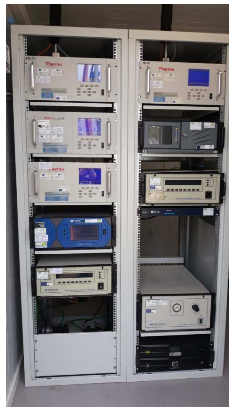
Interior Estación Torneo