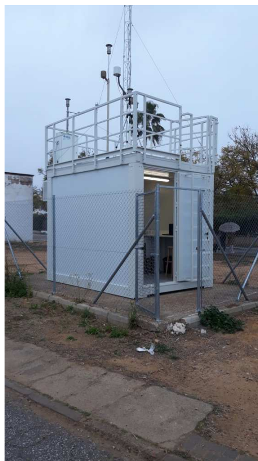
Estacion Santa Clara

Valor límite diario: 125 \mu\text{g}/\text{m}^3 , valor que no podrá superarse en más de 3 ocasiones por año civil.