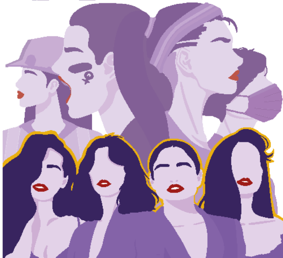
Imagen Gráfica y Eslogan: 2º Grado de Publicidad y RRPP. Facultad de Comunicación / Univ. de Sevilla