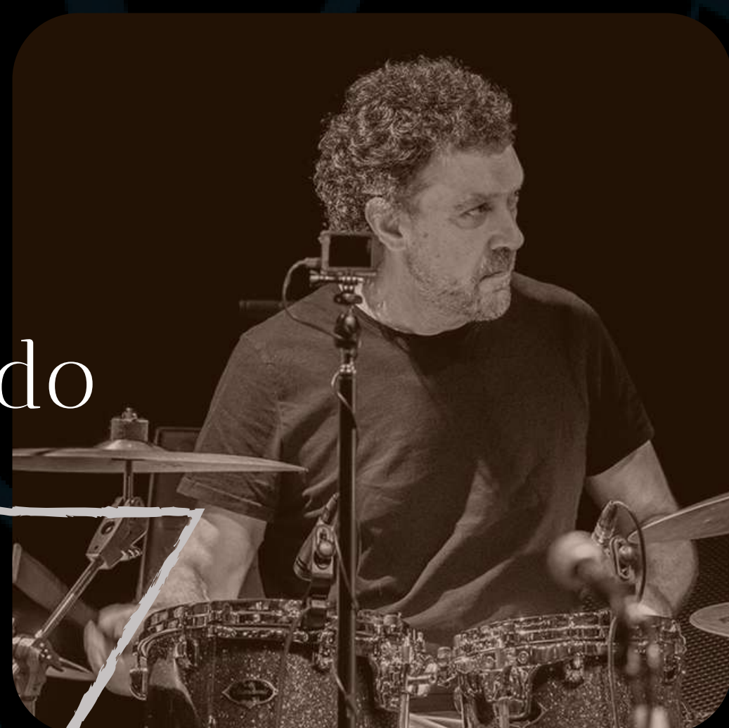
Tino Di Geraldo

Percusionista, tablista y baterista. Considerado uno de los principales percusionistas en España, aportando influencias clásicas y del jazz al flamenco, con un trasfondo punk-rock. Ha compartido escenario con artistas de la talla de Camarón, Paco de Lucía, Manolo Sanlúcar, Pepe Habichuela o Vicente Amigo en el mundo del flamenco; en el pop-rock Juan Perro, Cómplices o Golpes Bajos. Actualmente sigue siendo y después de 30 años, el batería de Luz Casal.