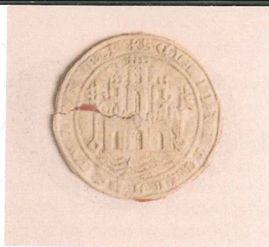
Sello de placa de Alcalá de Guadaíra

forjada. En esos 12.000 Km 2 aproximados que pertenecían a la ciudad ya se distinguen cuatro comarcas: las Sierras, el Aljarafe, la Campiña y la Ribera. El dominio de la ciudad sobre los concejos que había en ella abarcaba todos los ámbitos posibles. Como contrapartida, los vecinos de la ciudad y de su alfoz podían aprovecharse de los bienes comunales de todo el territorio y circular dentro de este territorio de Sevilla sin tener que pagar los tributos que sí debían abonar los que no eran vecinos.