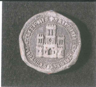
Sello de plomo de Alfonso X: castillo