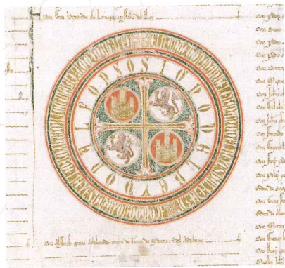
Exención de hospedaje a los vecinos de Sevilla