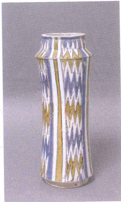
Albarelo Depósito del Ayto. de Sevilla. Museo de Artes y Costumbres Populares de Sevilla

Alfonso X refundó, organizó y restauró la ciudad. Este monarca puso las bases y los cimientos de la actual Sevilla y hoy día, 800 años después de su nacimiento, su huella en la ciudad sigue siendo evidente.