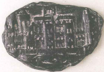
Sello de Sevilla, pendiente de cera: la imagen de la ciudad amurallada

y que quiso que quedara en la catedral hispalense. Es bien sabido que este monarca destaca por su legado cultural, por la renovación temática y artística que supuso la elaboración de unos códices de gran belleza. Algunos, como las Cantigas , Libros del ajedrez , dados y tablas o parte de las Siete Partidas fueron realizados en el Alcázar sevillano.