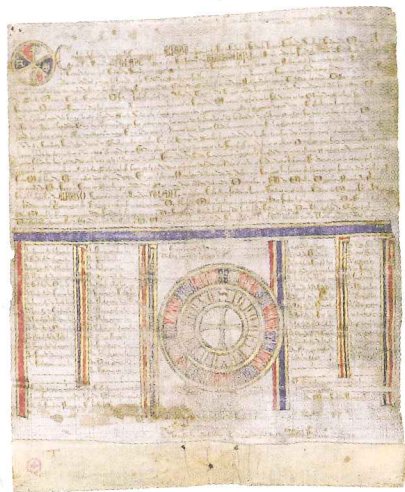
Donación a Sevilla de Morón, Cazalla, Osuna, Lebrija

Varias instituciones colaboran en ella con el préstamo de diferentes piezas. Destaca el Archivo municipal de Sevilla, que conserva un notable