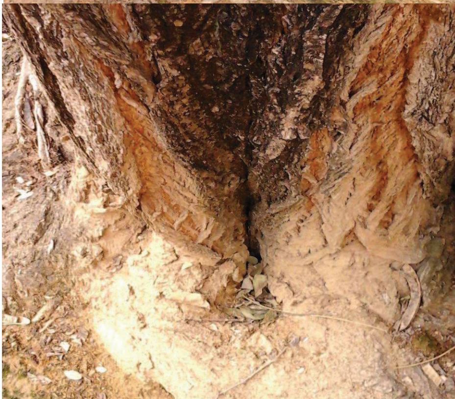
Detalle raíces superficiales. Acostillamiento con cavidades en la base del tronco.