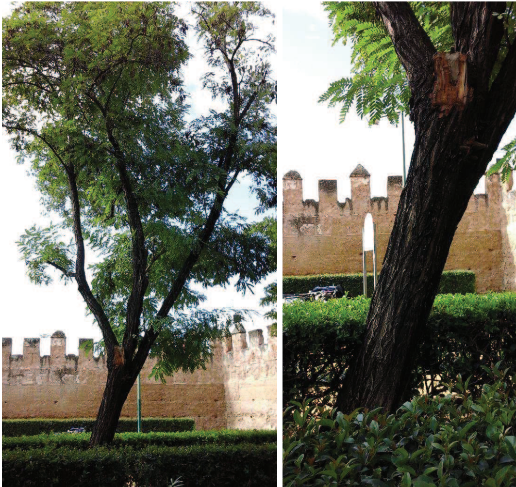
Vista general. Detalle ligera inclinación de tronco. Herida por desgajamiento en cruz.