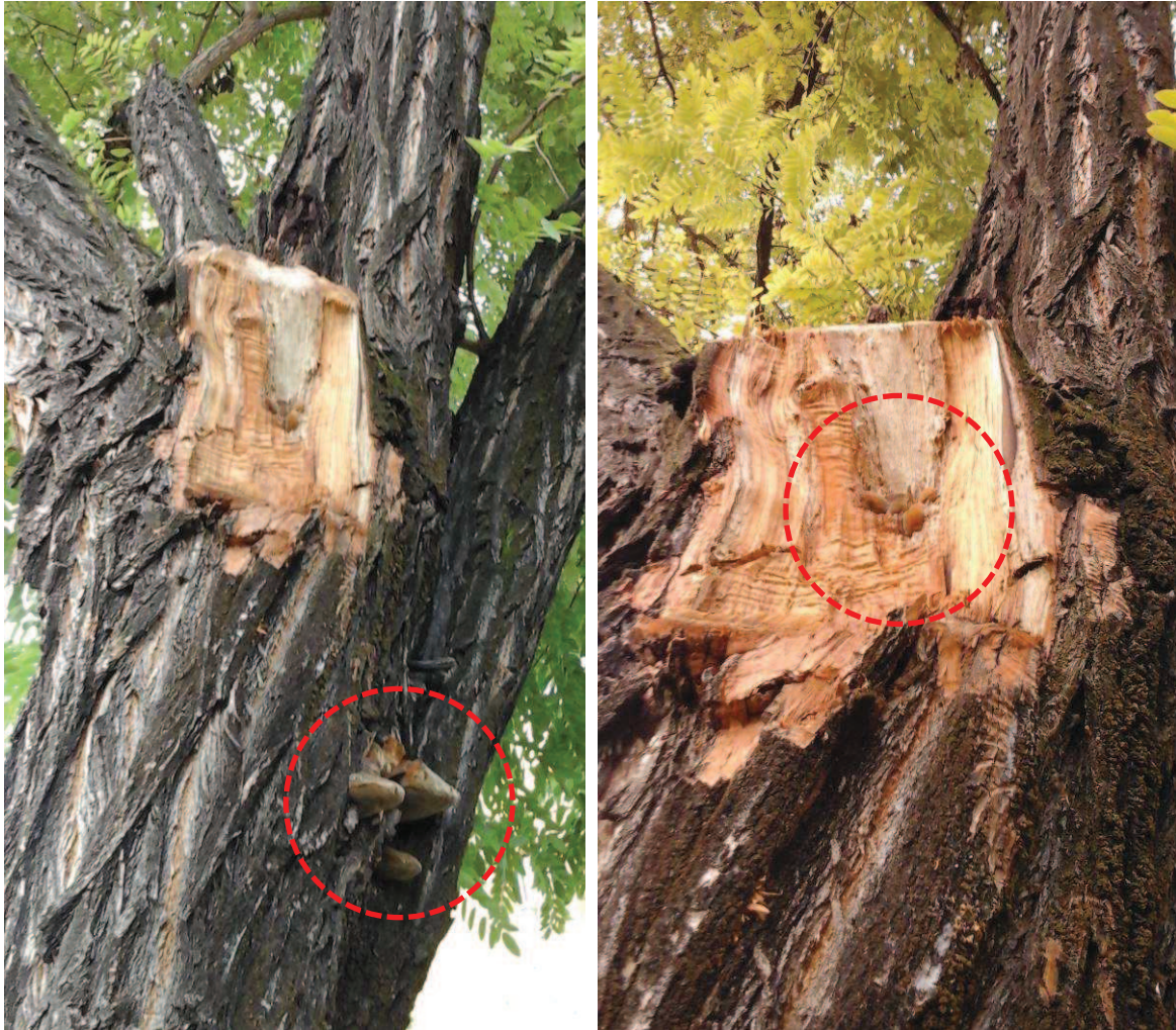
Detalle cuerpos fructíferos cruz, madera incluida y grieta vertical en una de las ramas primarias. Cuerpos fructíferos incipientes que surgen por la herida tras el desgaje de una de las ramas primarias.