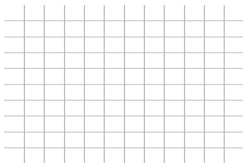
Matriz 2. Matriz de clasificación de riesgo.