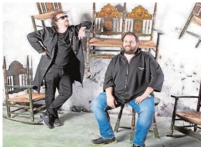
Los Voluble presentan su nueva obra el día 22 en San Jerónimo

Las funciones tienen lugar a las 22 horas y aún quedan entradas para ambos días.