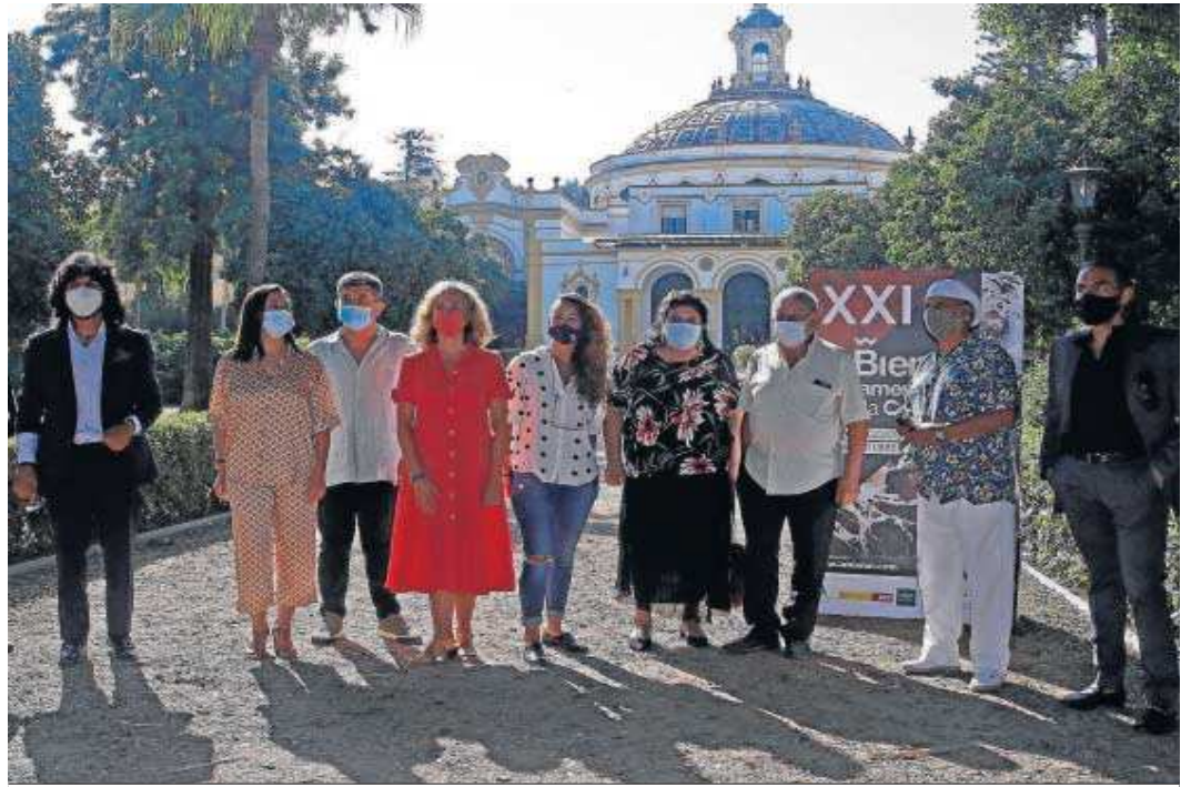
Los artistas participantes en los recitales de cante, ayer en el exterior del Lope de Vega, el gran teatro de solera flamenca en Sevilla.