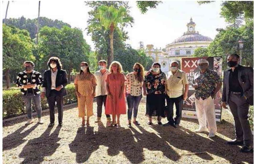
En la presentación se destacó que los espectáculos mezclan la tradición e innovación en el flamenco.