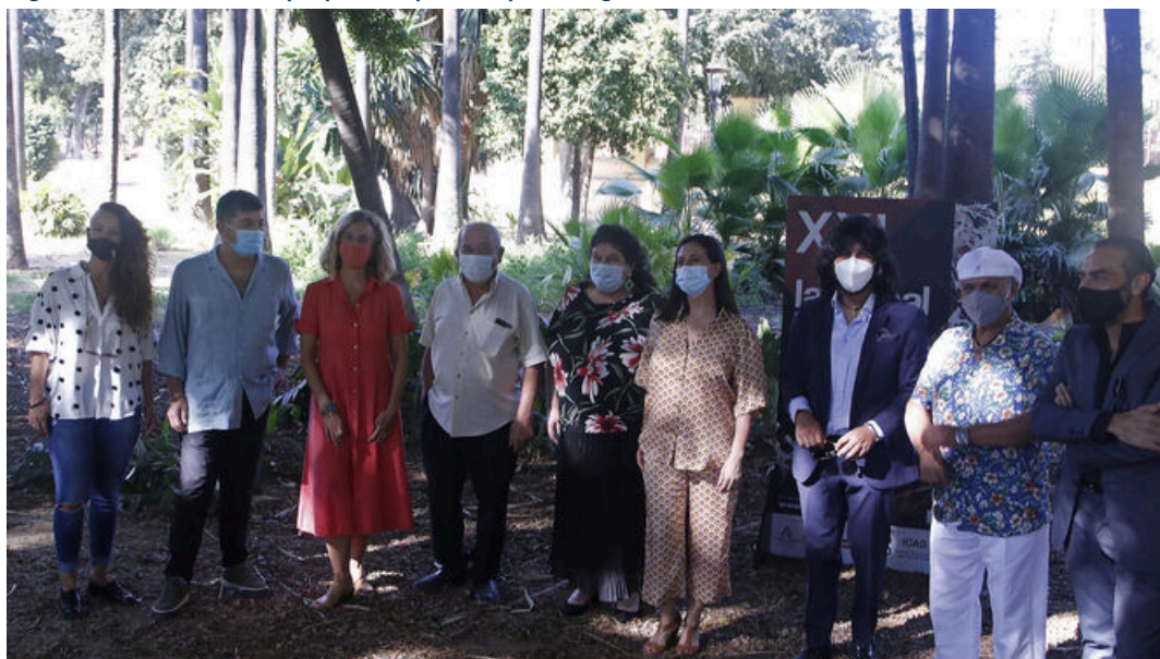
Algunos de los cantaores que pasarán por el Lope de Vega esta Bienal / José Ángel García (Sevilla)

Algunos de los cantaores que pasarán por el Lope de Vega esta Bienal