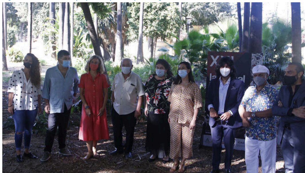
Algunos de los cantaores que pasarán por el Lope de Vega esta Bienal / José Ángel García (Sevilla)

Algunos de los cantaores que pasarán por el Lope de Vega esta Bienal