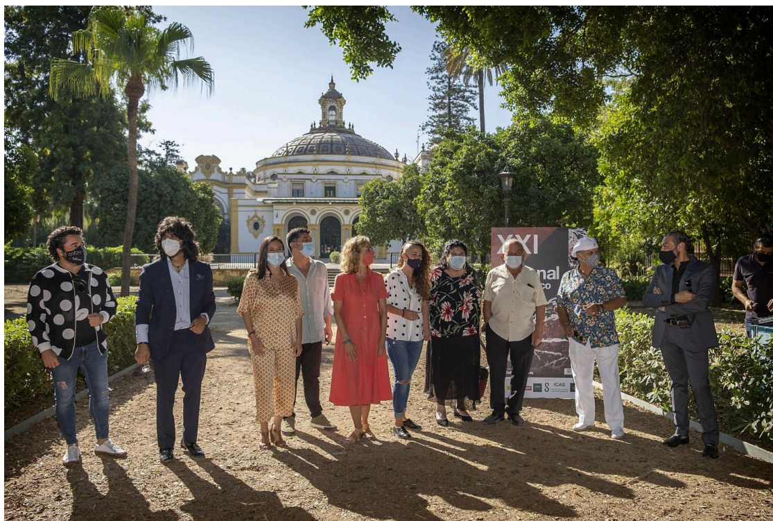
Encuentro con algunos de los cantaores que participan en la Bienal de Flamenco, este miércoles en Sevilla.