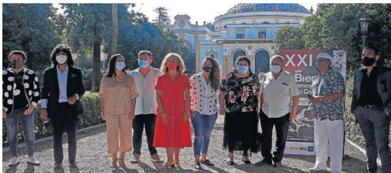
Algunos de los protagonistas en la rueda de prensa celebrada ayer en el Casino de la Exposición de Sevilla.

● La Bienal de Flamenco de Sevilla presenta el ciclo de recitales que arranca este próximo lunes 7 de septiembre con José Valencia y cerrará el 4 de octubre Estrella Morente