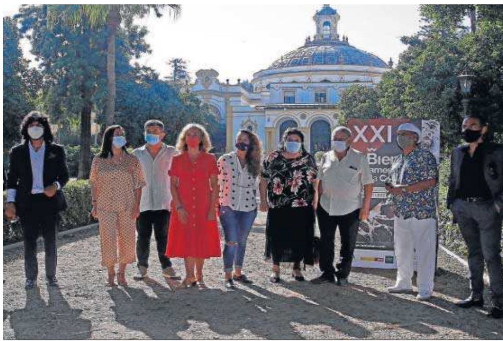
Los artistas participantes en los recitales de cante, ayer en el exterior del Lope de Vega, el gran teatro de solera flamenca en Sevilla.