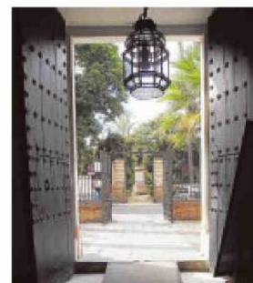
Hospital de la Caridad

El Centro Andaluz de Arte Contemporáneo, en el marco de su ciclo de música jazz, propone para esta noche el concierto de