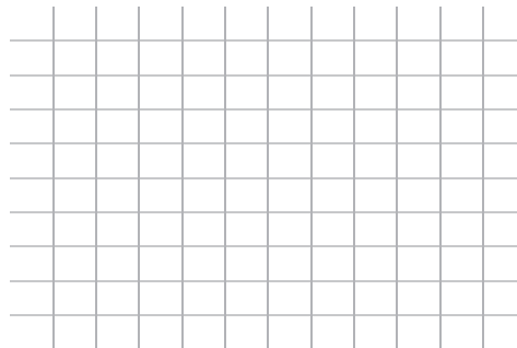
Matriz 2. Matriz de clasificación de riesgo.