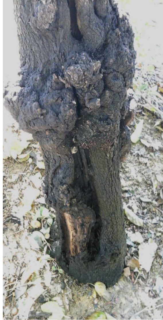
Detalles cavidades, madera vista y tumoraciones a lo largo del tronco