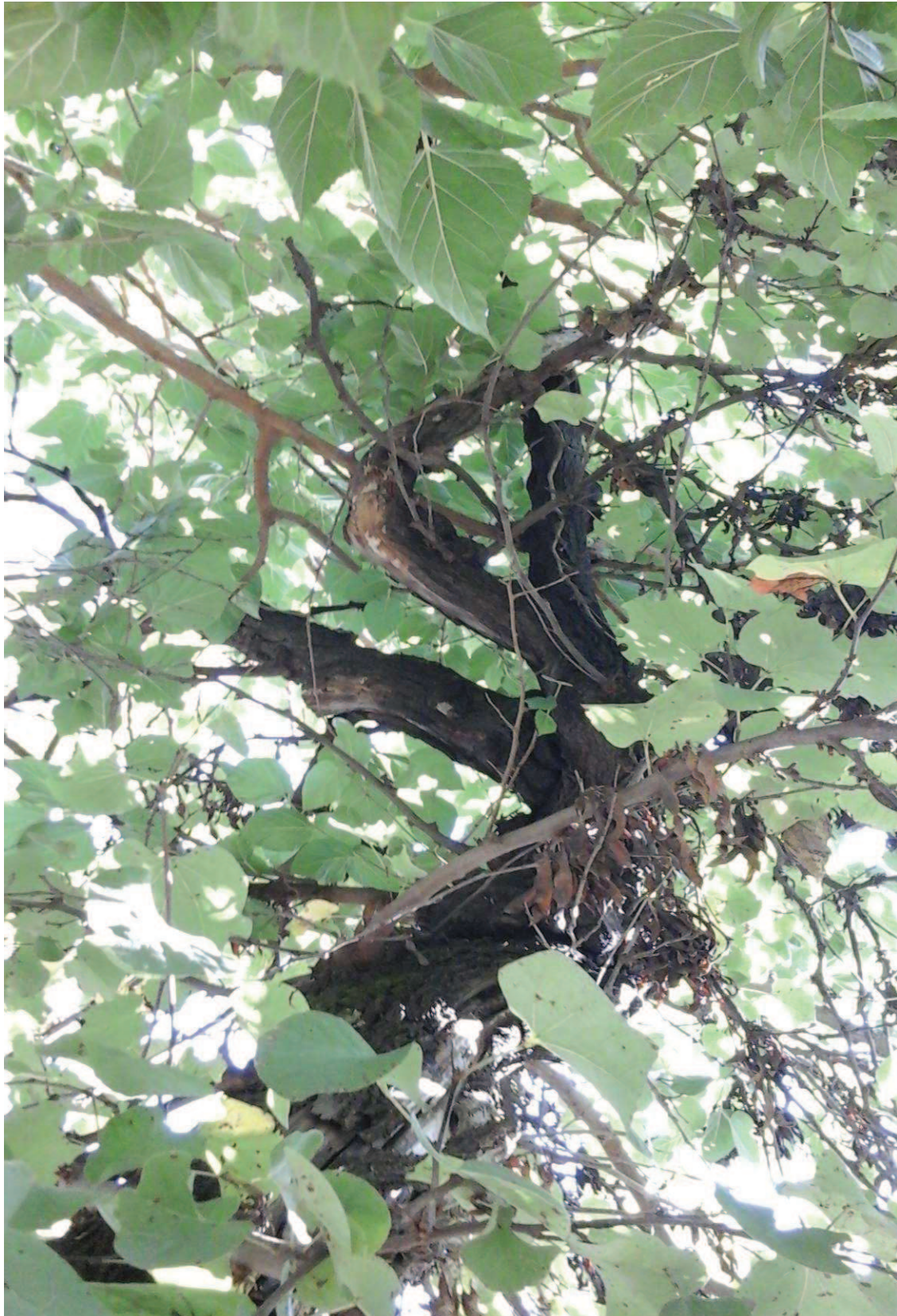
Detalle pésima estructura primaria