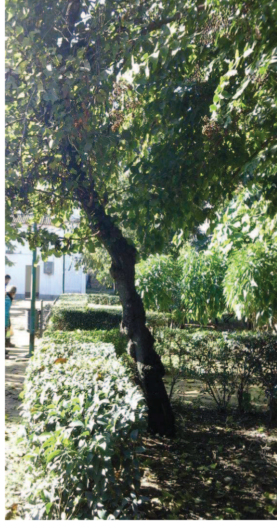
Vista general. Detalle inclinación tronco.