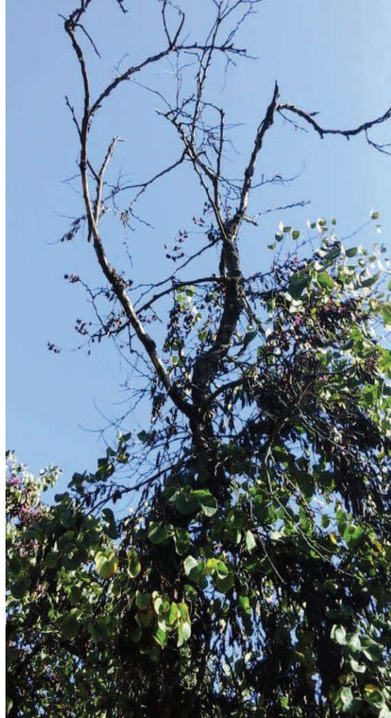
Detalle de chupones fallidos y sequedad rama secundaria. Sin estructura primaria.