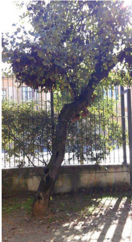
Vista general. Detalle inclinación y grietas en tronco.