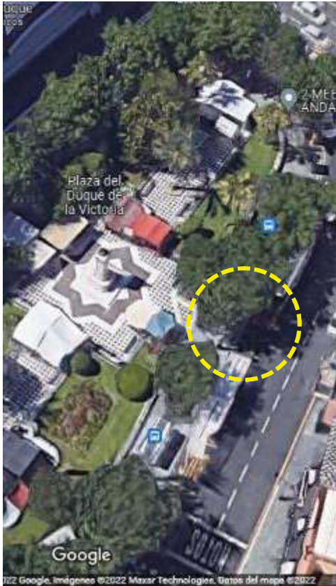
Localización: Plaza del Duque, Distrito Casco Antiguo