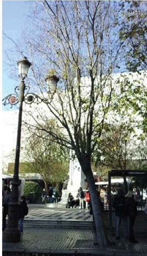
Vista general: inclinación activa y pérdida de verticalidad, a la izquierda foto del 2022-12 y a la derecha foto actual.