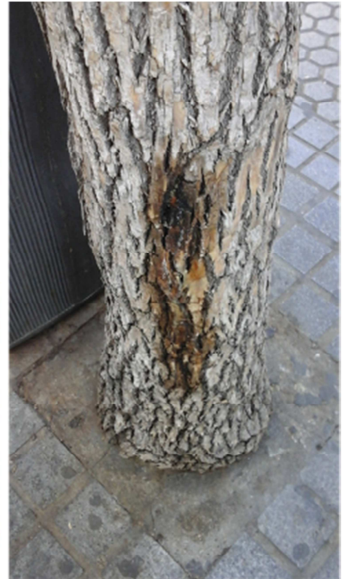
Detalle gomosis en la parte inferior del tronco, posible actividad fúngica.