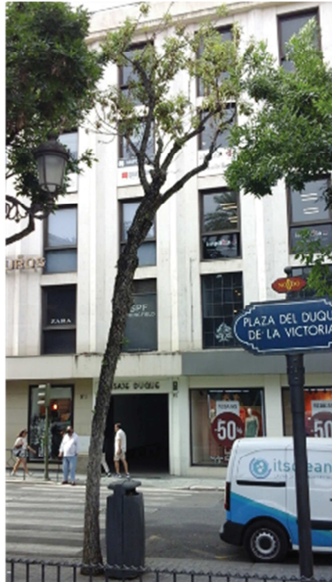
Vista general: árbol inclinado/curvado, decrepito. Interferencias con mobiliario urbano, farola y tránsito de peatones y vehículos