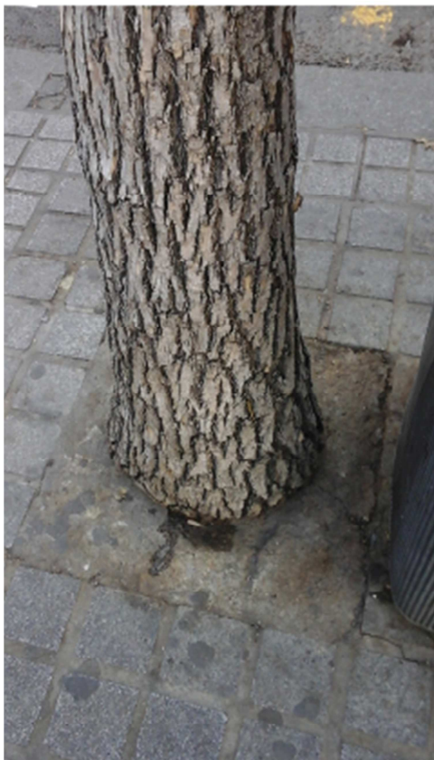
Detalle alcornoque cegado con adoquines y cemento: anillamiento del tronco y posible anoxia radicular.