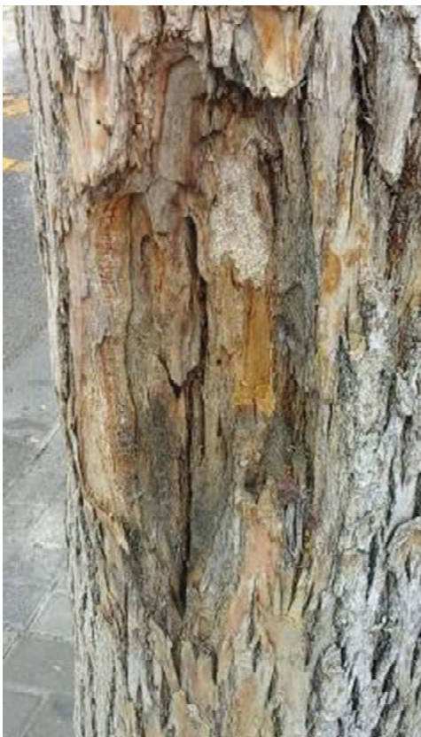
Detalle chancro con fendas, pudrición y ataque de perforadores y hormigas de la madera: cavidad.