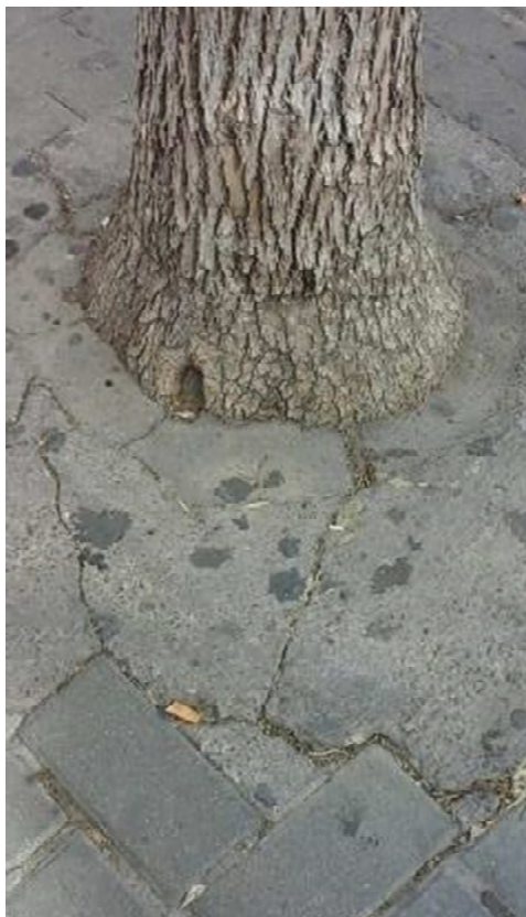
Detalle alcorque cegado con adoquines y cemento: anillamiento del tronco y posible anoxia radicular