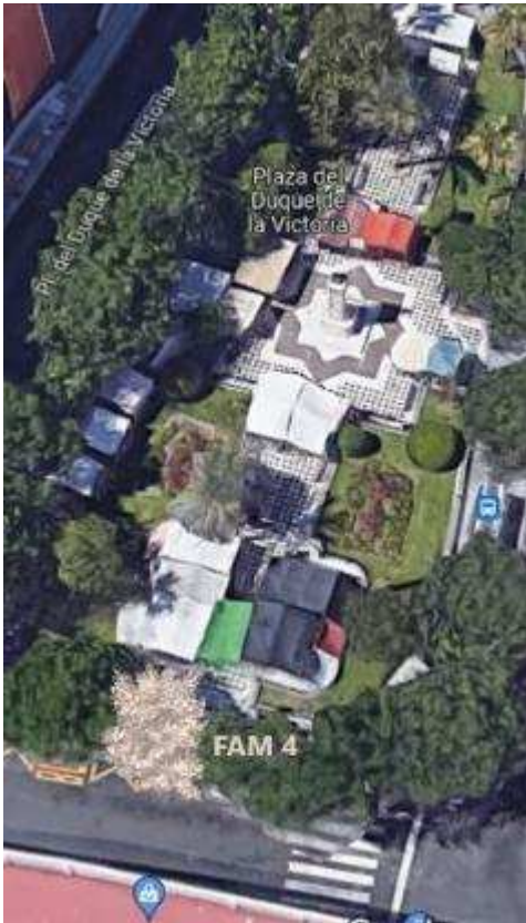
Localización: Plaza del Duque, distrito Casco Antiguo