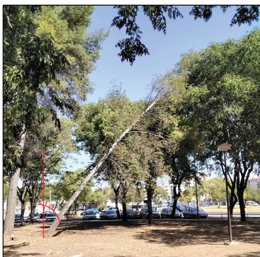
Imagen 1: Vista general, indicada inclinación.