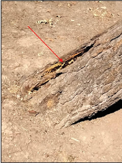
Imagen 2: Detalle grieta en cuello con rotura de fibras.