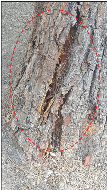
Imagen 4: Detalle grieta en cuello.