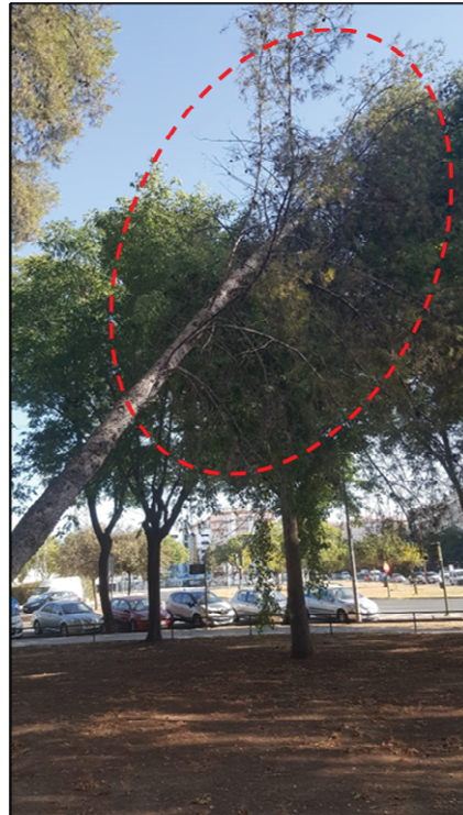
Imagen 5: Ejemplar desvitalizado, presencia de acículas secas.