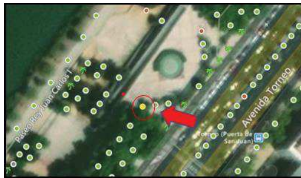
Localización en amarillo del ejemplar valorado

Sevilla, 19 de marzo del 2023 El Ingeniero Técnico Agrícola