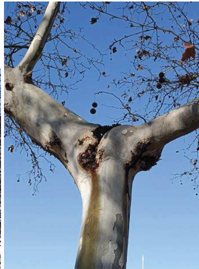
Detalles de la cruz