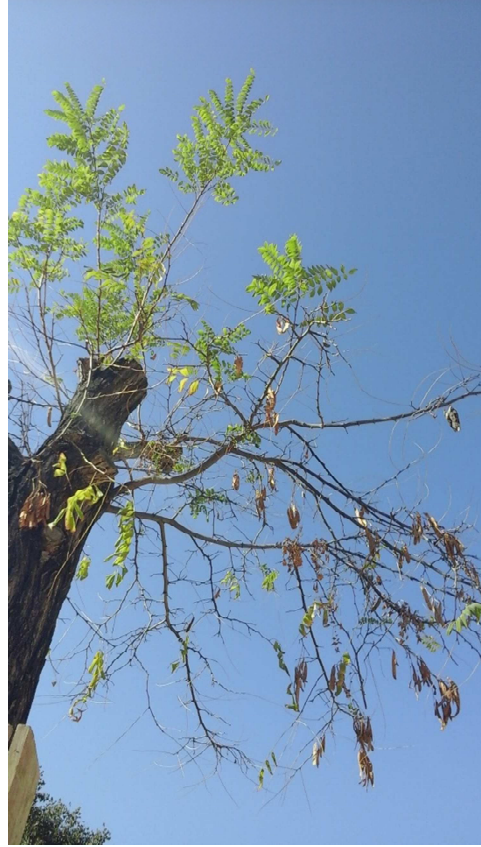
Cavidad longitudinal. Defoliación y ramas secas superior al 90% de la copa antes de terciado por limpieza.