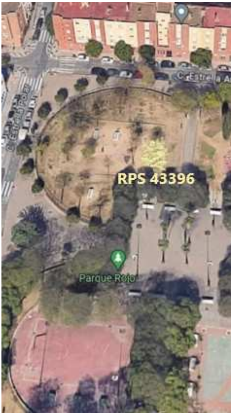
Localización: ID 43396, MANZANA 67, JARDINES PLAZA, distrito Norte