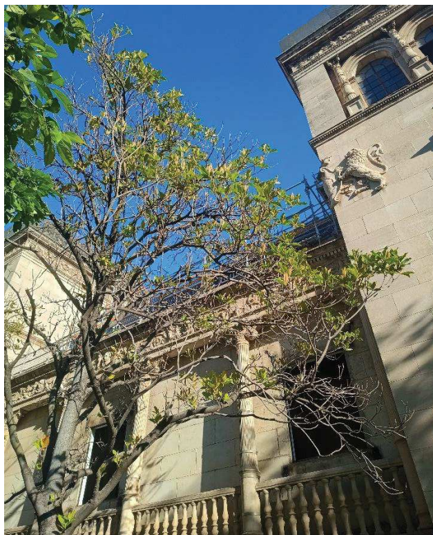
Signos de desvitalización en cara este de la copa.