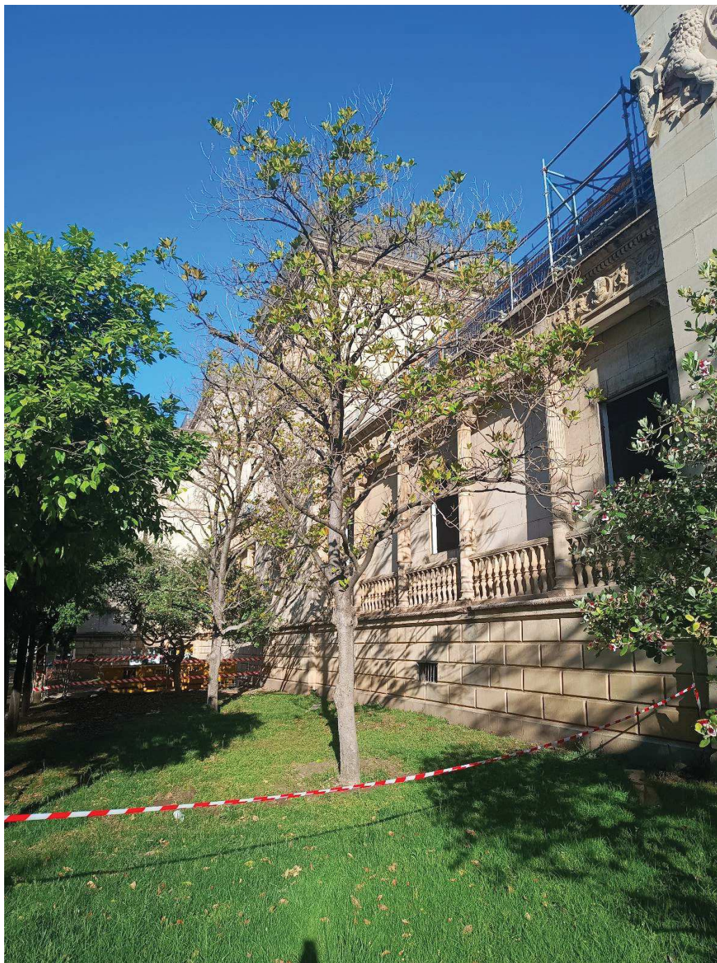
Vista general del árbol afectado