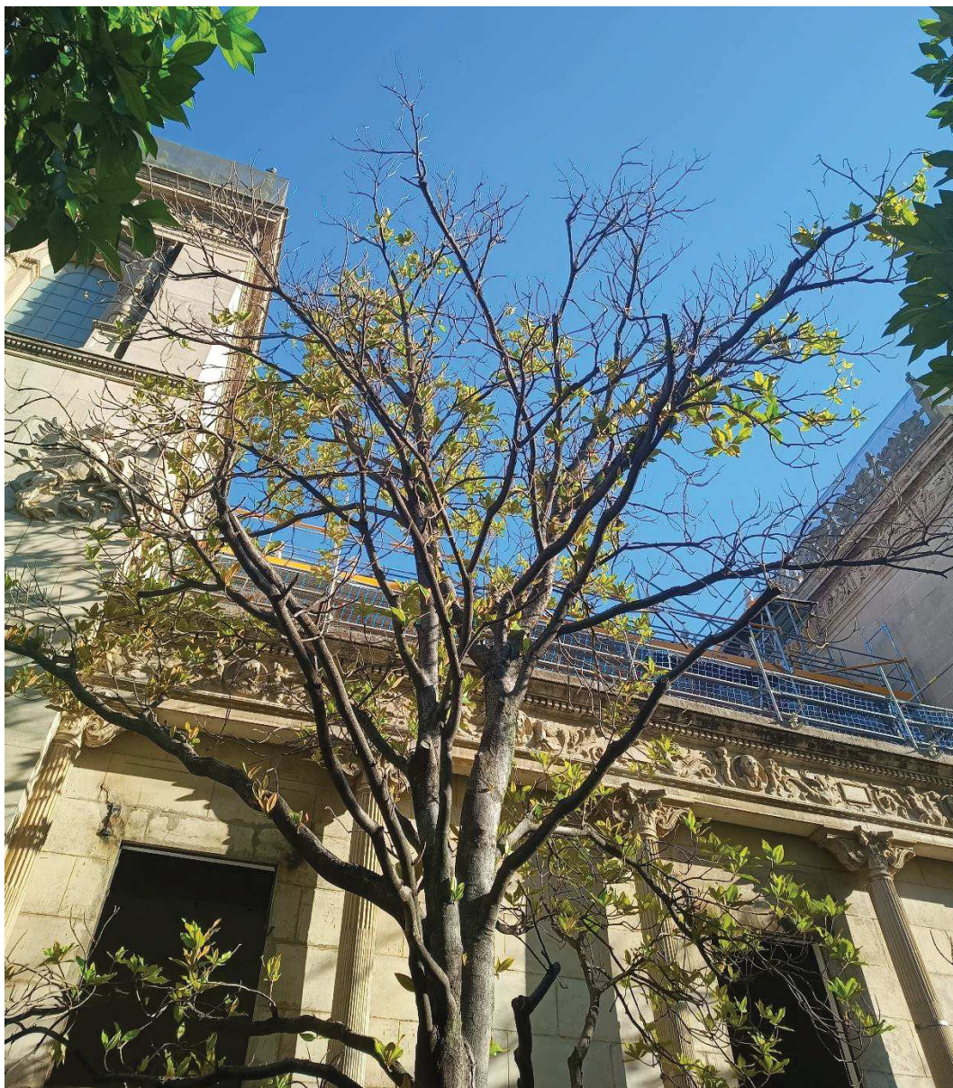
Detalle de los signos de desvitalización de la copa.