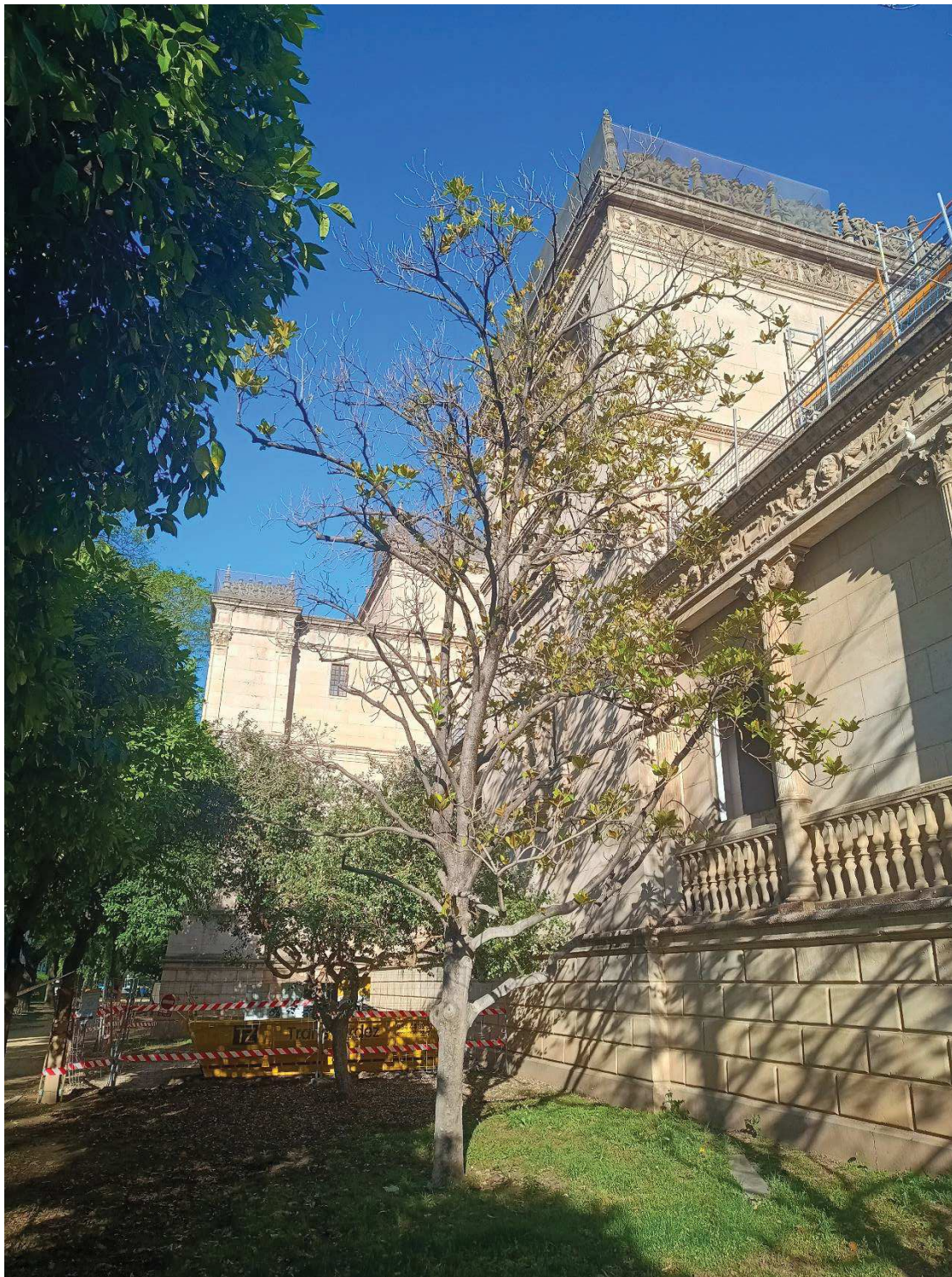
Vista general del ejemplar.