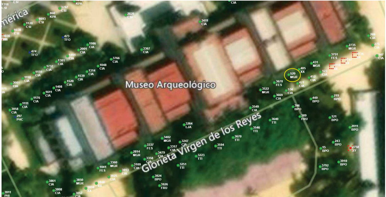
Localización del árbol marcado en amarillo.