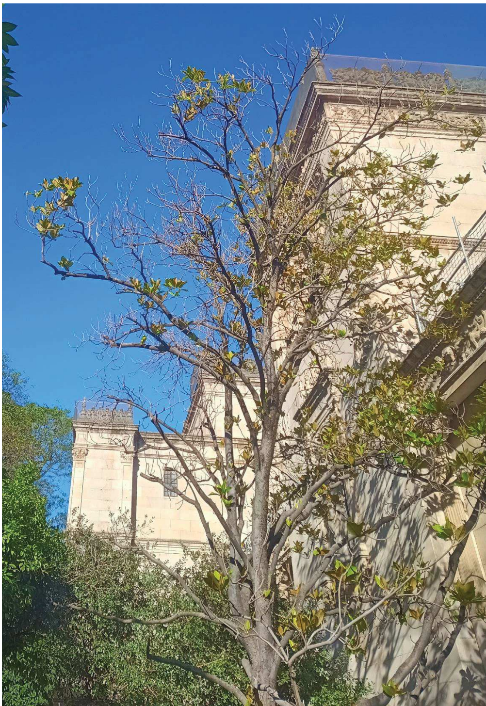
Presencia de ramas secas en la copa.