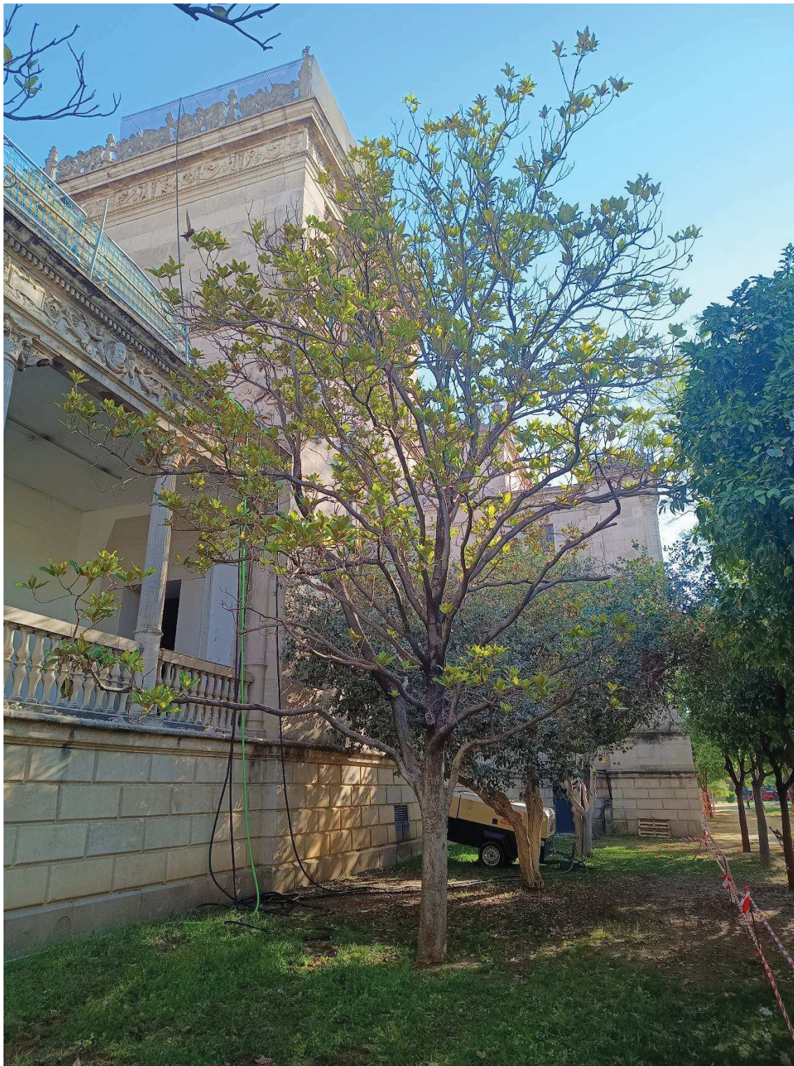
Vista general del ejemplar.