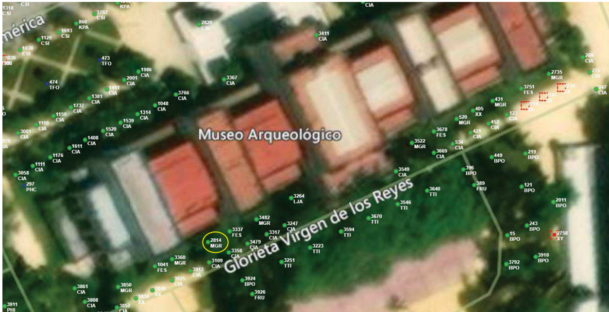
Localización del árbol marcado en amarillo.