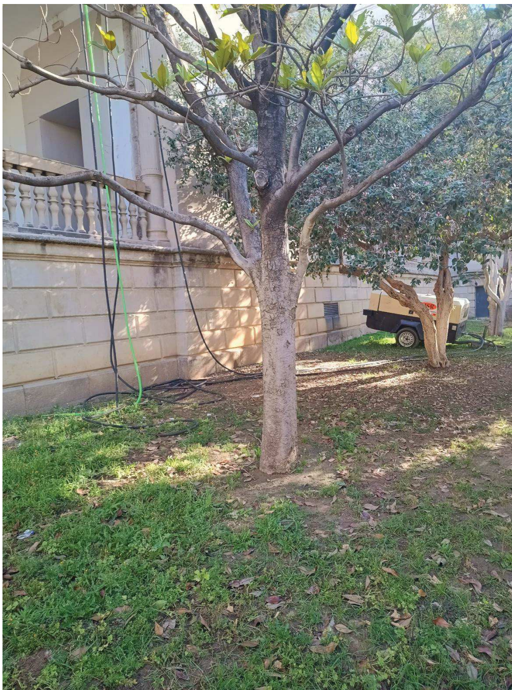
Detalle del tronco del árbol afectado.