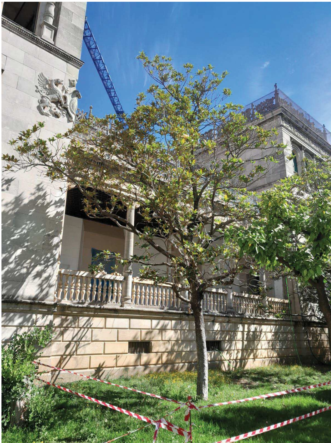
Vista general del árbol afectado