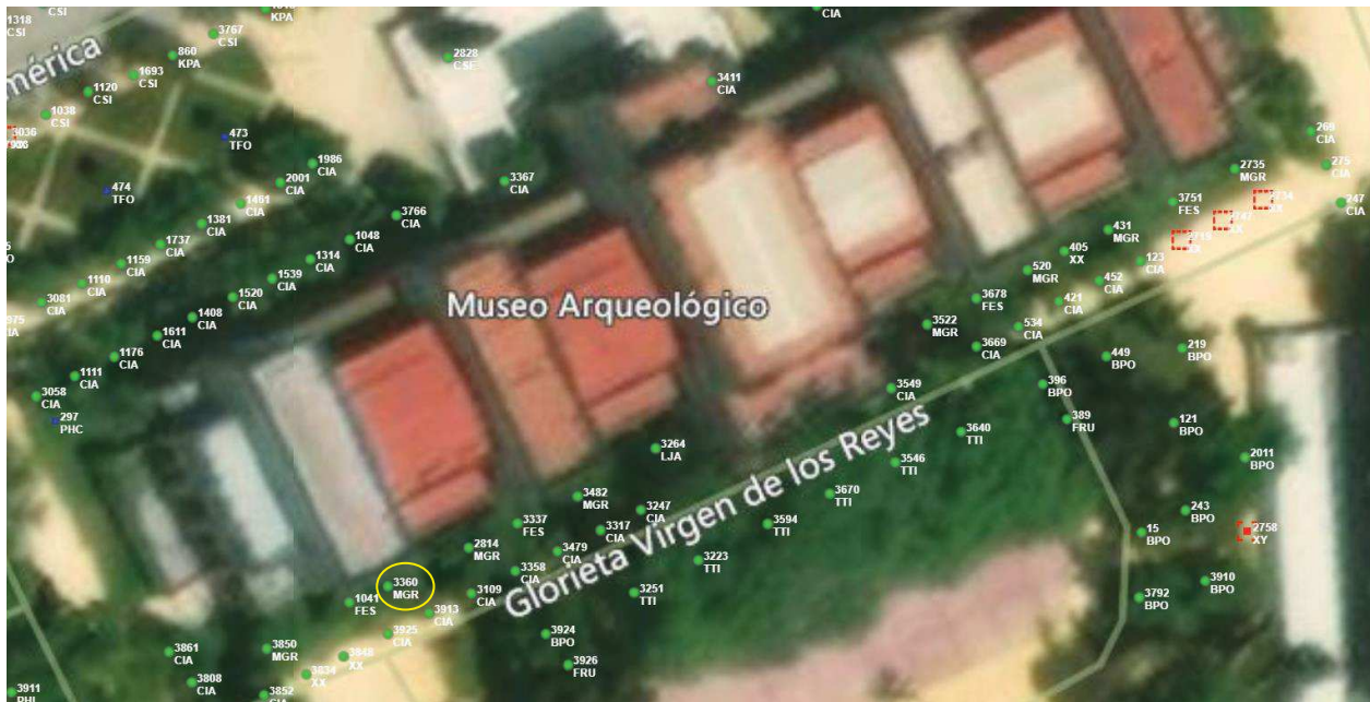
Localización del árbol marcado en amarillo.