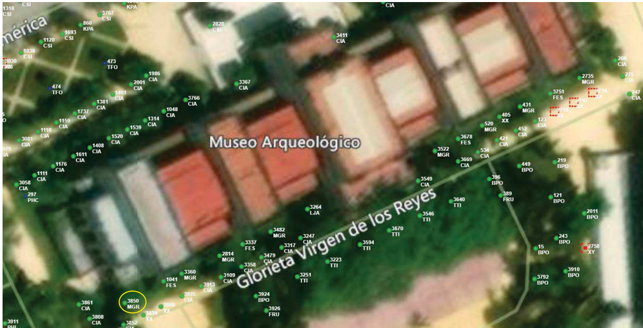
Localización del árbol marcado en amarillo.