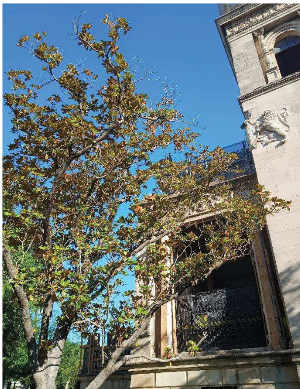
Detalle de síntomas de desvitalización de la copa.