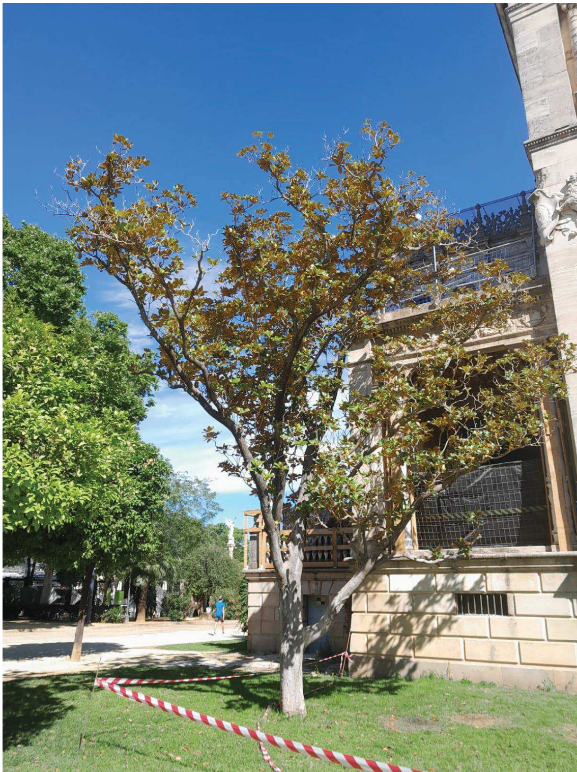
Vista general del árbol afectado