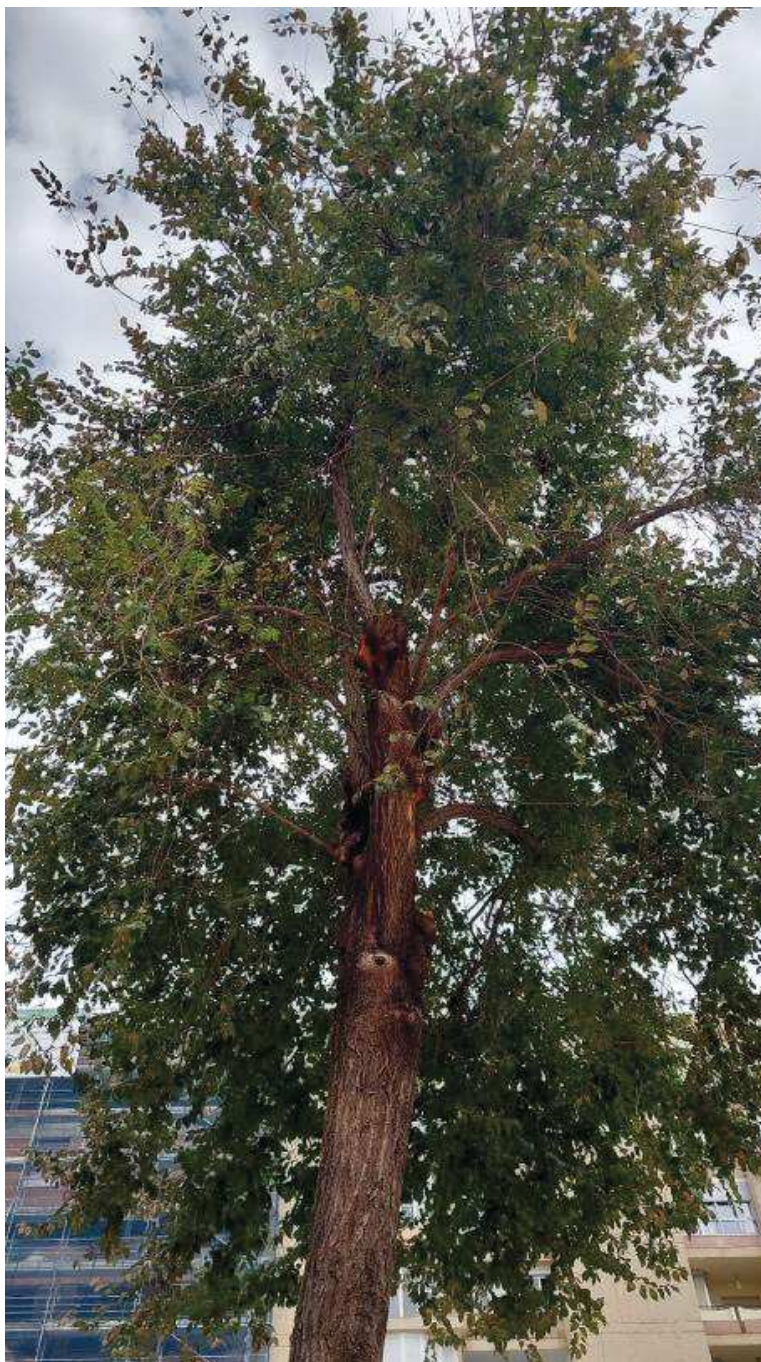
Calle Nicolás Alpérez s/n (Pabellón de la Telefónica de la Exposición de 1929) 41013 Sevilla Teléfono 95 54 73232