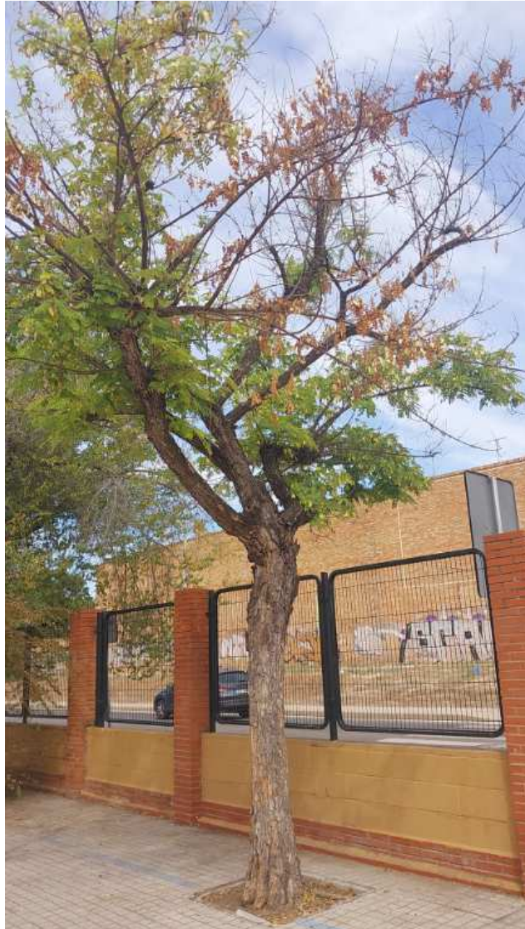
Calle Nicolás Alpérez s/n (Pabellón de la Telefónica de la Exposición de 1929) 41013 Sevilla Teléfono 95 54 73232