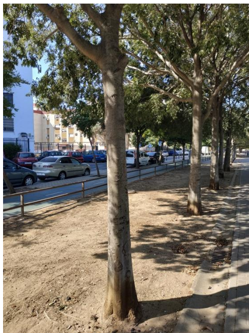
Imágenes del ejemplar con id 248