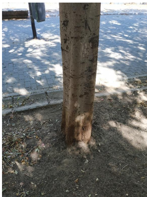
Imágenes del ejemplar con id 136